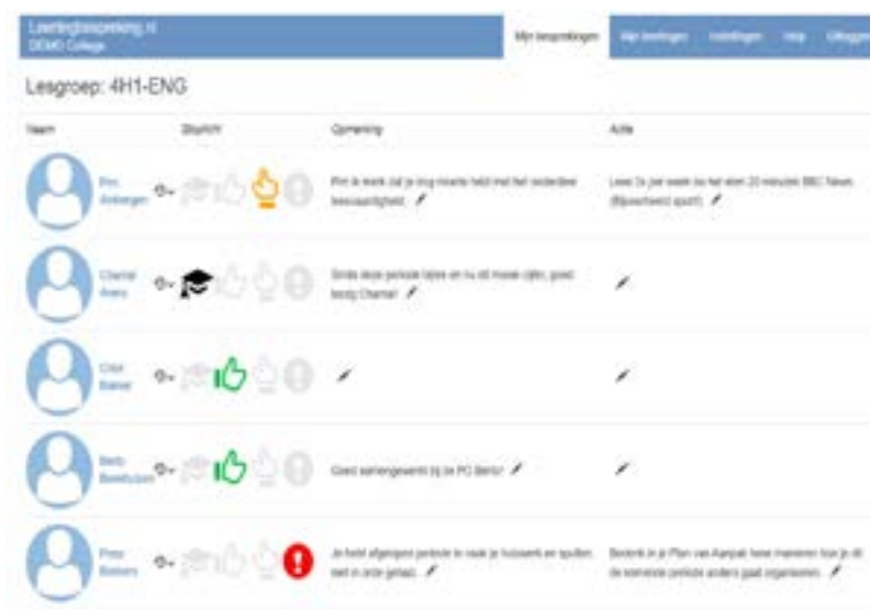
Afbeelding: voorbeeld Catwise dashboard

Twee keer per jaar krijgt jouw kind van iedere docent feedback via Catwise. Het gaat hierbij niet over de cijfers, maar over het proces. De vakdocenten vullen "het stoplicht" en waar nodig feedback in. Leerlingen maken een plan van aanpak voor vakken waar dit bij nodig is. Deze feedback en het plan van aanpak kan ook onderdeel zijn van de driehoeksgesprekken.